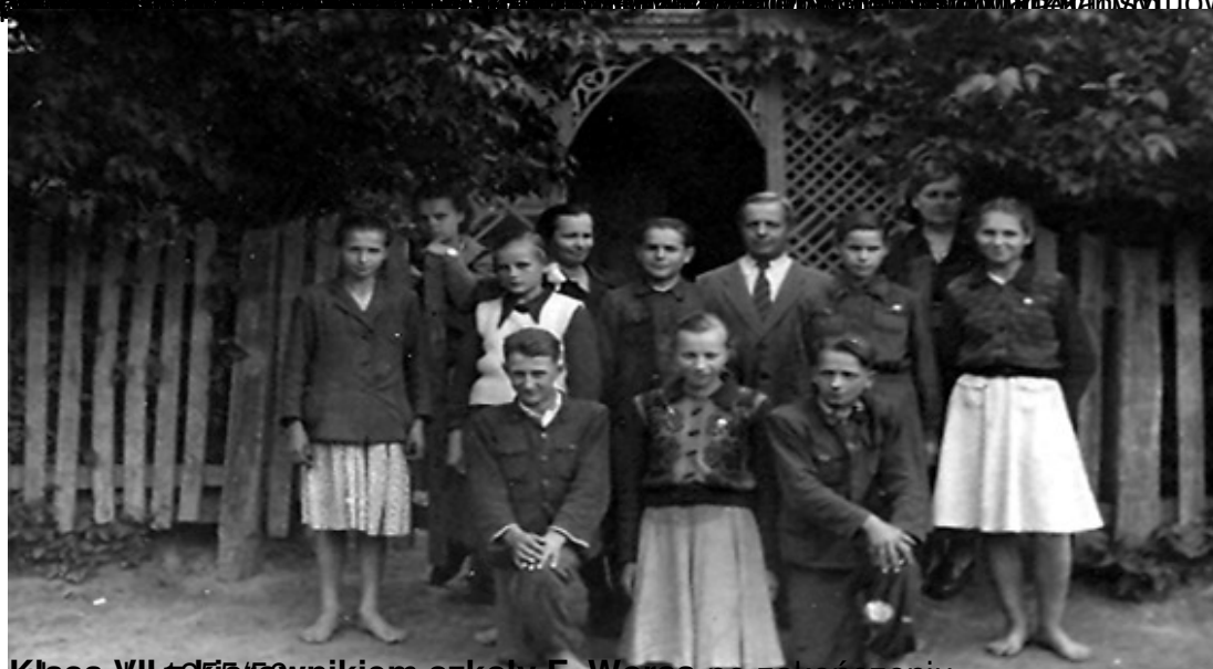
Klasa VII z 1915/16 zwnikiem szkoły F. Worsą po zakończeniu