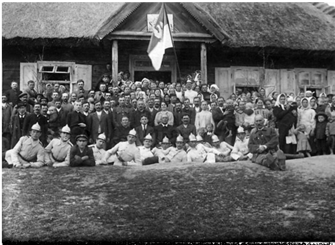
Przedstawienie w centralnej

piątek, 25 marca 2011 22:09 - Poprawiony poniedziałek, 13 czerwca 2011 08:01