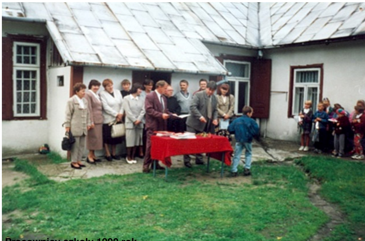
Pracownicy szkoły 1999 rok.

piątek, 25 marca 2011 22:09 - Poprawiony poniedziałek, 13 czerwca 2011 08:01